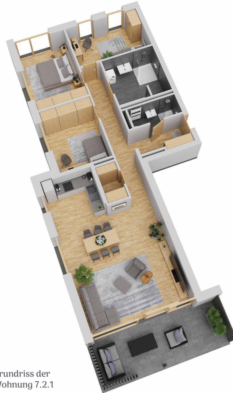
Grundriss der Wohnung 7.2.1